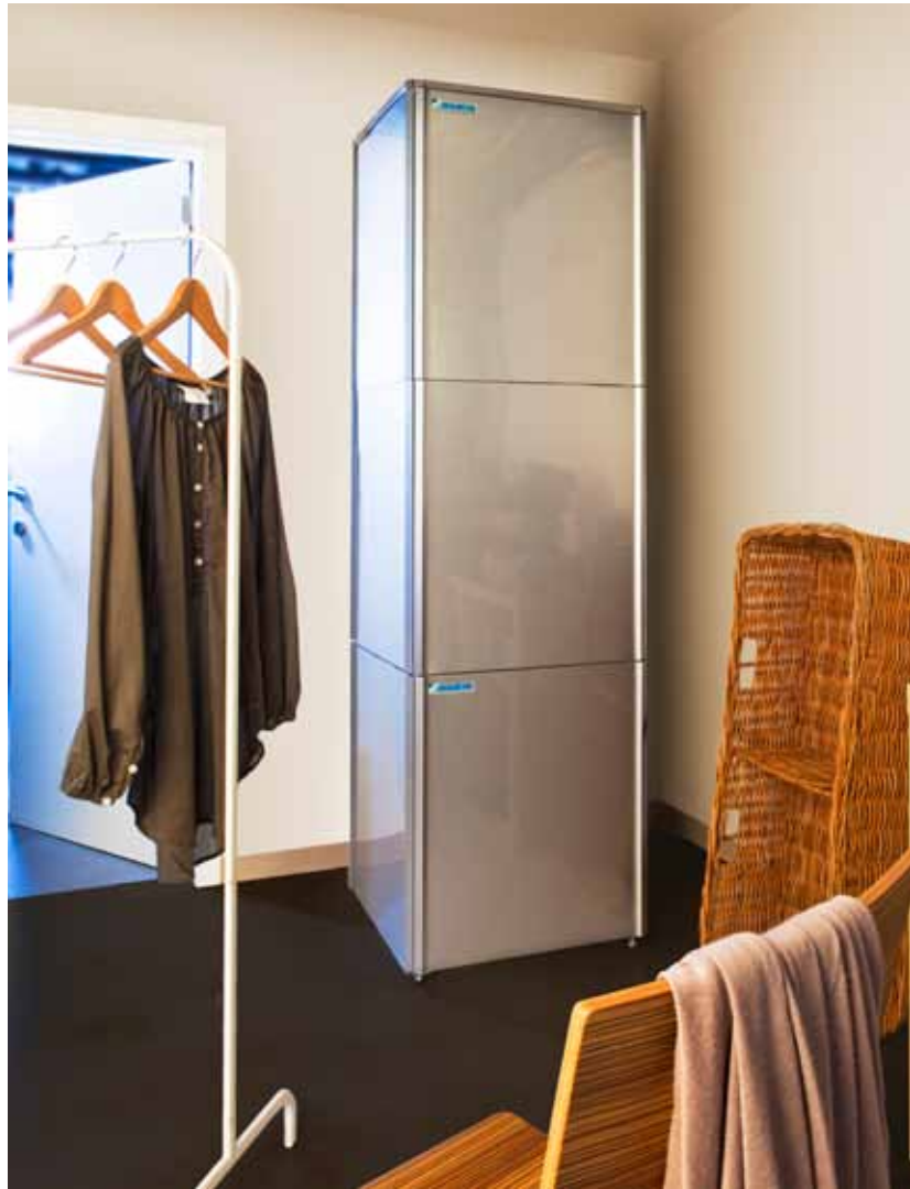
Vnitřní jednotku a zásobník teplé užitkové vody je možné umístit na sebe.

* COP (Coefficient of Performance) až 3,08 EW: 55 °C; LW 65 °C, Dt 10 °C; 7 °CDB/6 °CWB